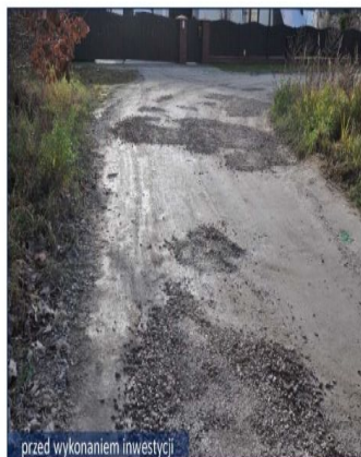
przed wykonaniem inwestycji

jezdnię asfaltową - koszt: 533 010,26 zł, kanalizację deszczową - koszt: 83 425,11 zł