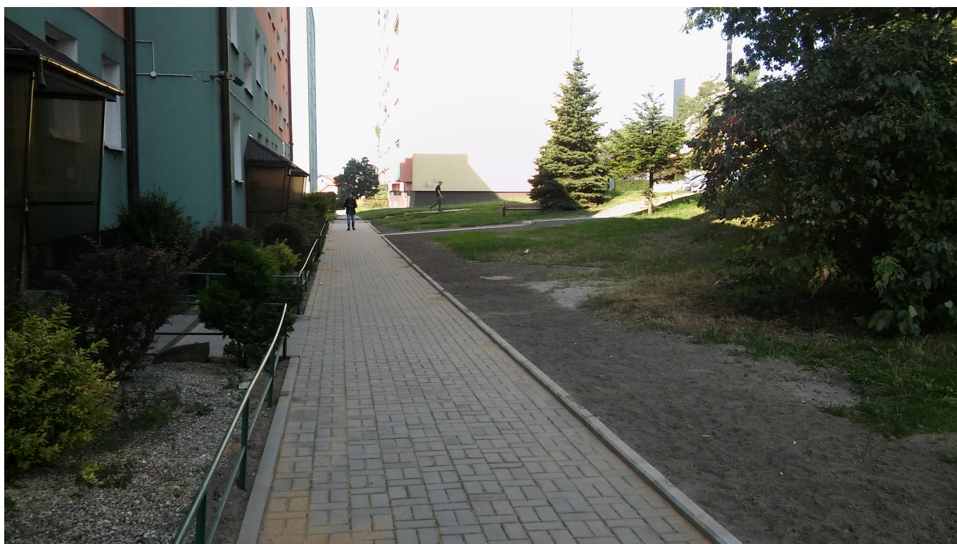
3. Wykonanie 6 miejsc postojowych przy ul. Majówka 11