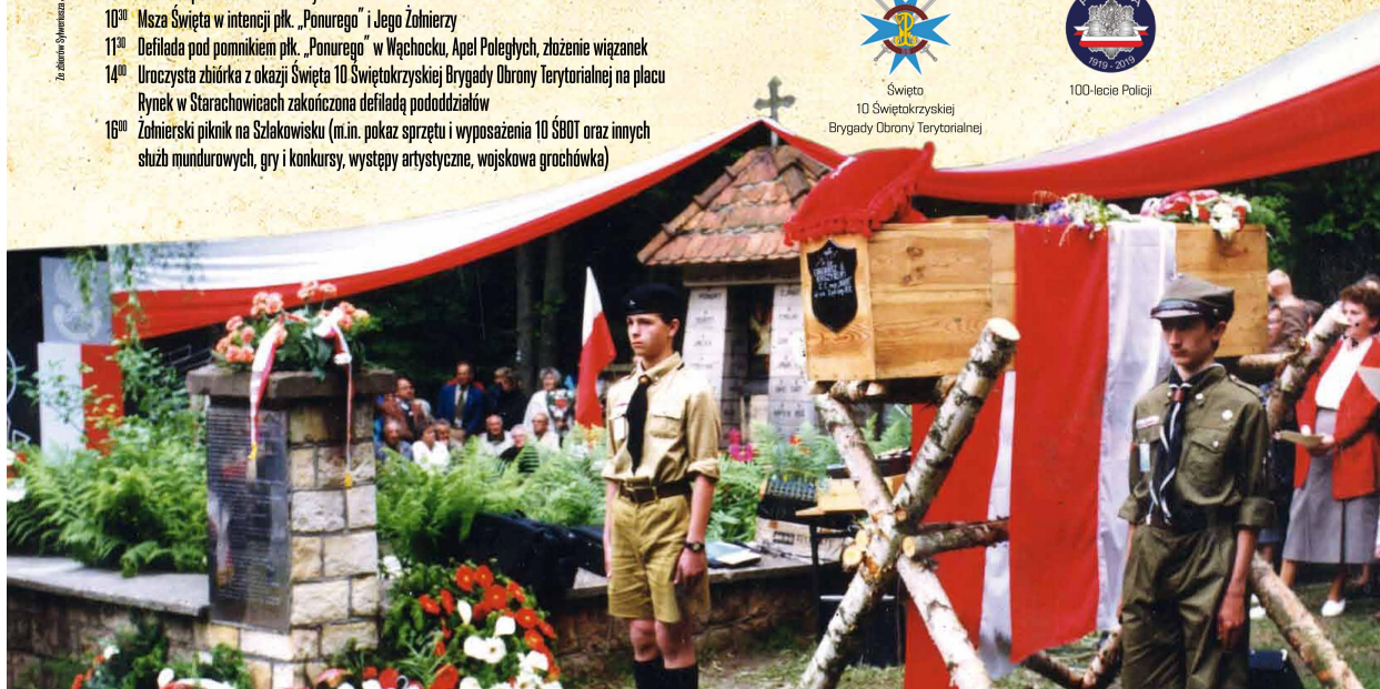
Wspieracie organizacyjnie i finansowo w organizacji uroczystości